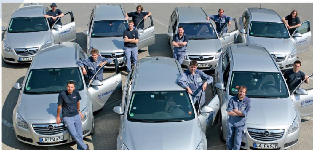
福乐伟的专业技术人员随时准备为您服务

您可以在我们的网站： www.flottweg.com 上找到我们所有分支机构和子公司的信息