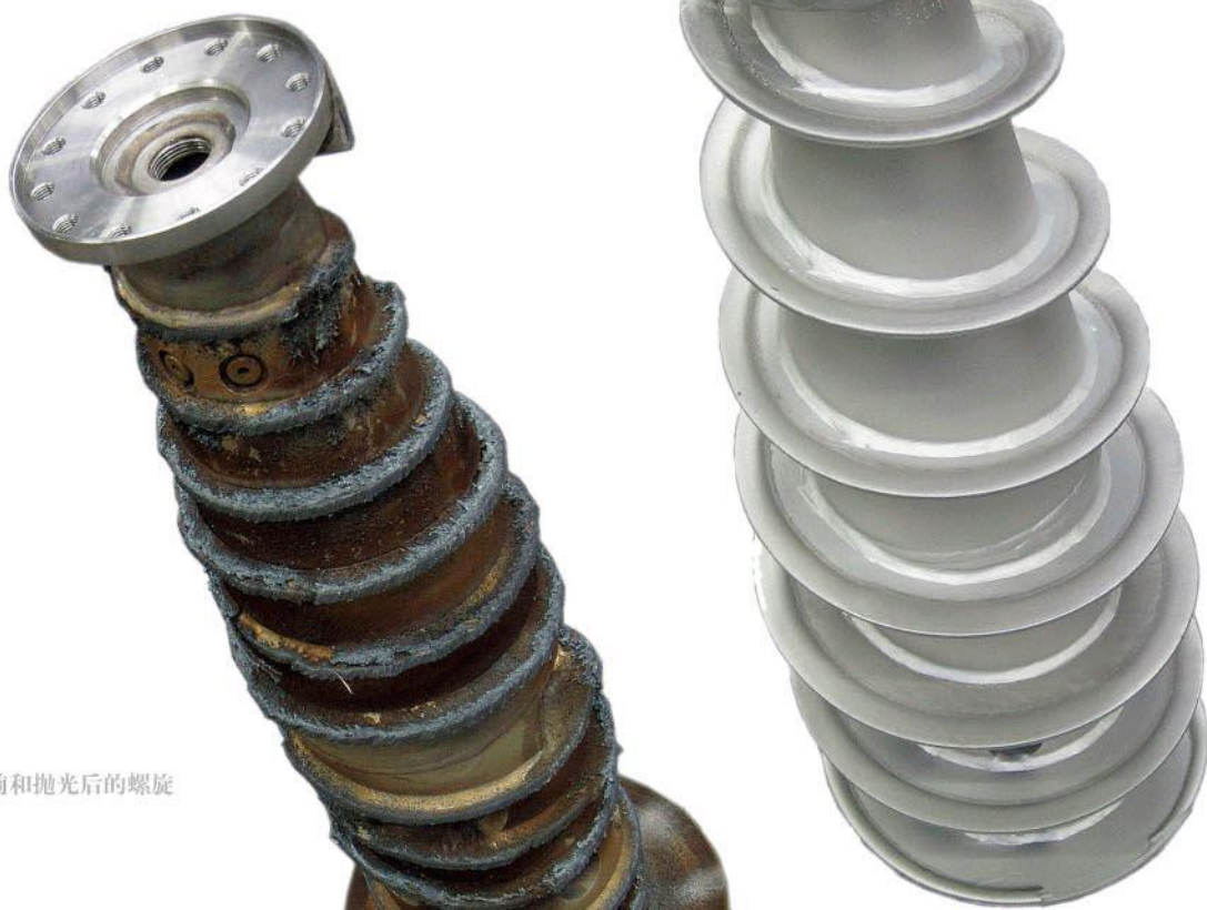
抛光前和抛光后的螺旋