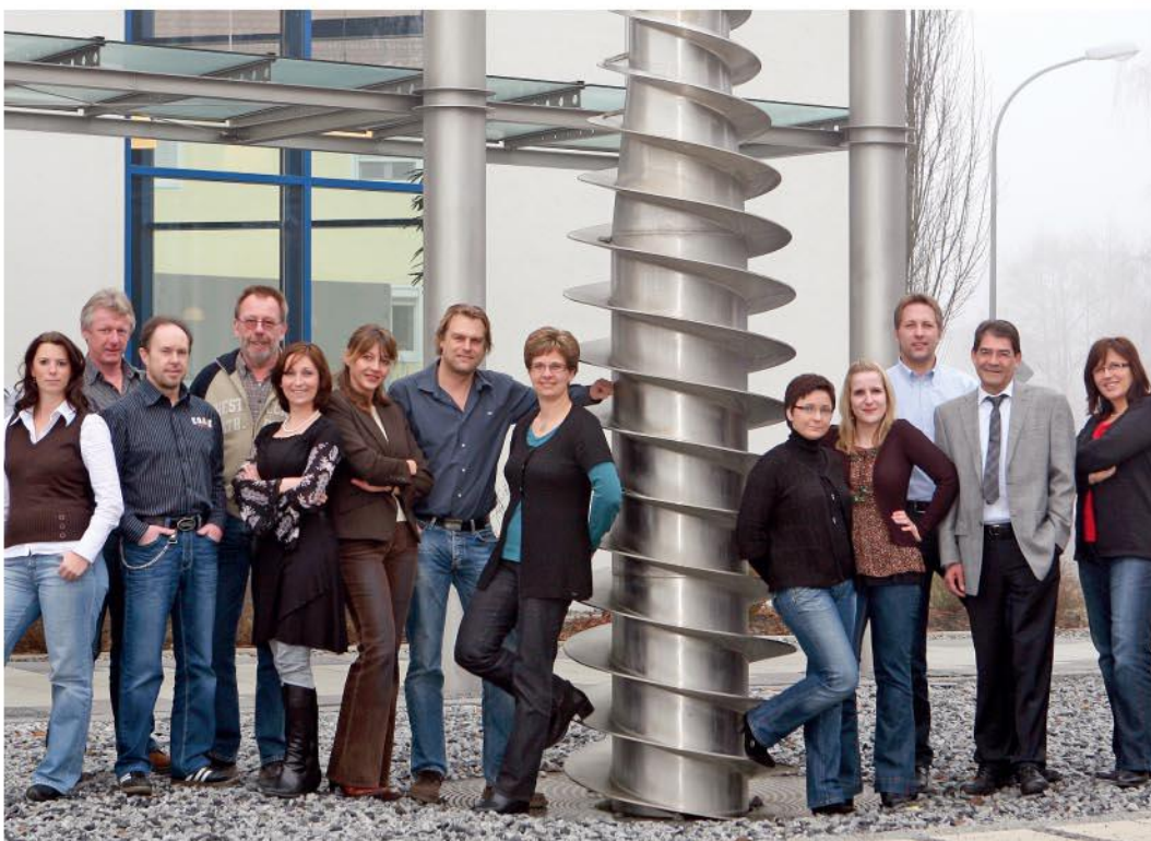
菲尔斯比堡总部的福乐伟服务团队