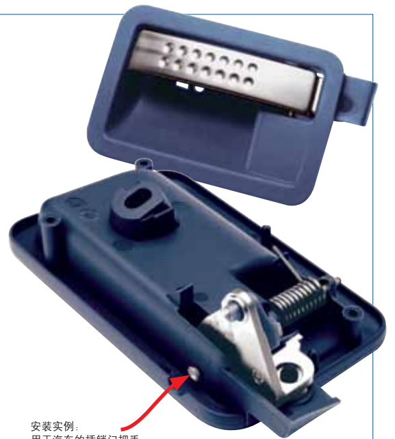
安装实例： 用于汽车的插销门把手