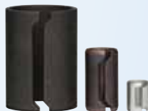
定位套/ 弹性定位销