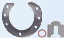
精加工垫片和 薄金属片冲压件